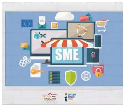
BONOS PARA PYMES