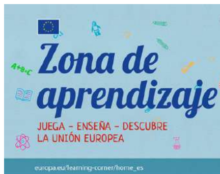
¡VAMOS A EXPLORAR EUROPA!