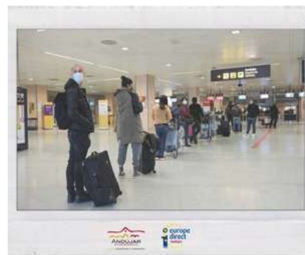
LA COMISIÓN PROPONE ACTUALIZAR LAS MEDIDAS PARA LOS DESPLAZAMIENTOS