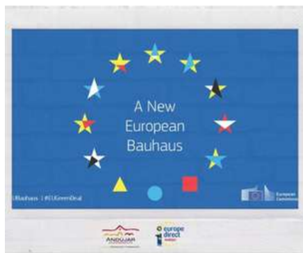
NUEVA BAUHAUS EUROPEA: SE INICIA LA FASE DE DISEÑO