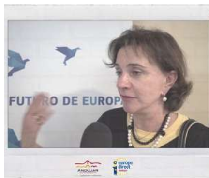
NUEVA JEFA DE LA REPRESENTACIÓN DE LA COMISIÓN EUROPEA EN ESPAÑA