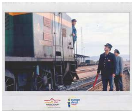
2021: ¡EL AÑO EUROPEO DEL FERROCARRIL!