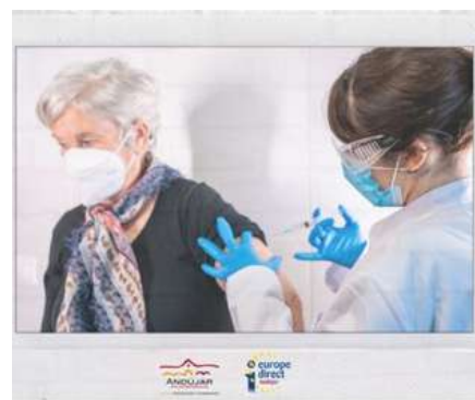
LA COMISIÓN PRESENTA ACCIONES CLAVE PARA UN FRENTE UNIDO CONTRA LA COVID-19