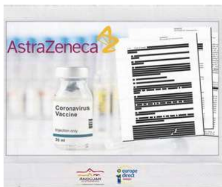
VACUNAS: PUBLICACIÓN DEL CONTRATO ENTRE LA COMISIÓN EUROPEA Y ASTRAZENECA